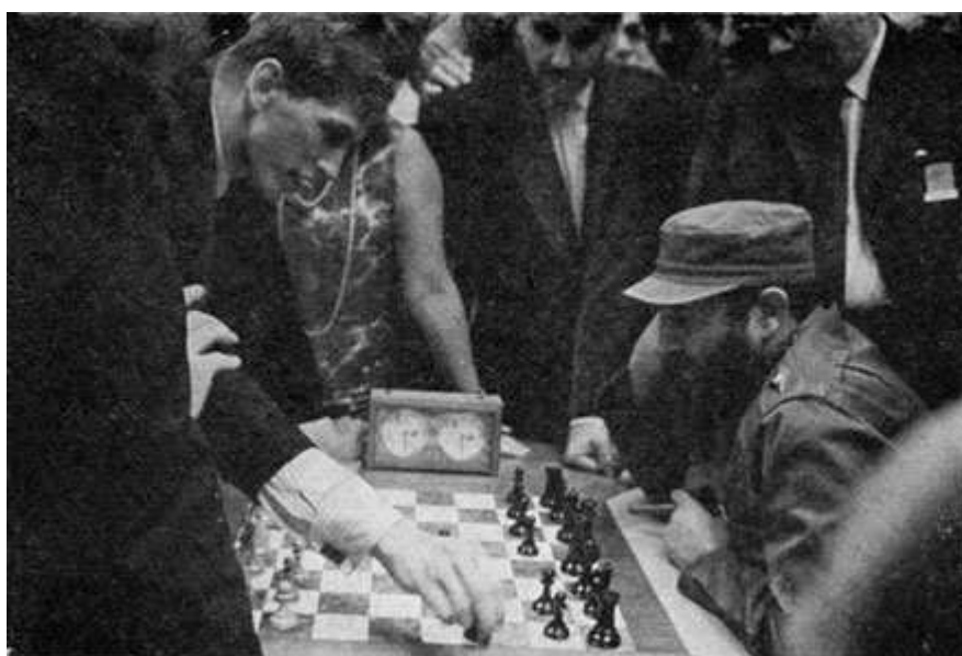
Fischer e Fidel Castro all'Avana 1966